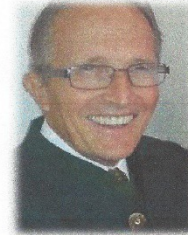
Dr Cornette de Saint Cyr

La maladie de Lyme sous ses multiples formes; et son rapport à l'immunité.